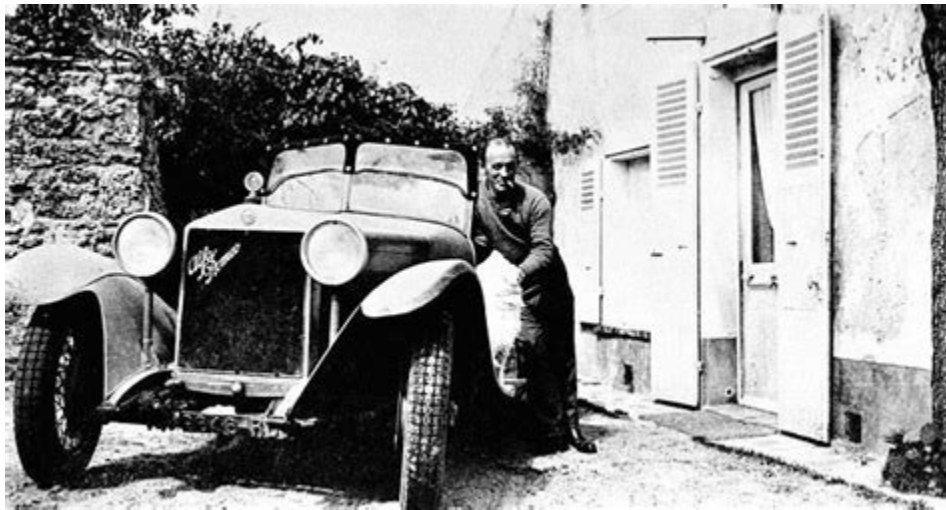
Blaise Cendrars et son Alfa Roméo au Tremblay/Mauldre

En 1923, Blaise Cendrars achète 1000 francs à Georges Braque l'Alfa Roméo rouge 6C 1500 dont l'artiste avait lui-même dessiné la carrosserie et peint les couleurs.